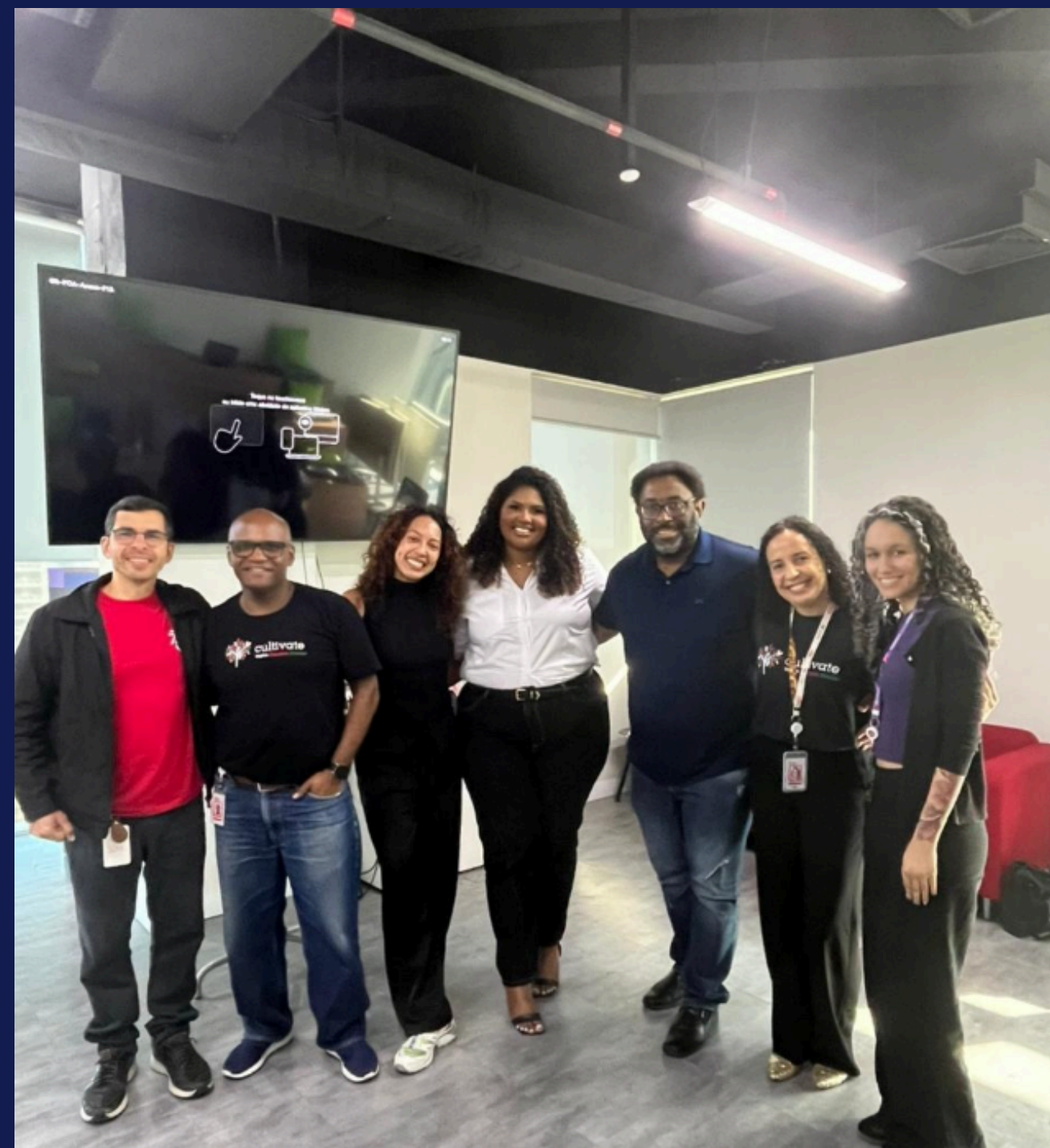
Imagem: registro de membros do Cultivate com a palestrante. Porto Alegre, em novembro de 2025