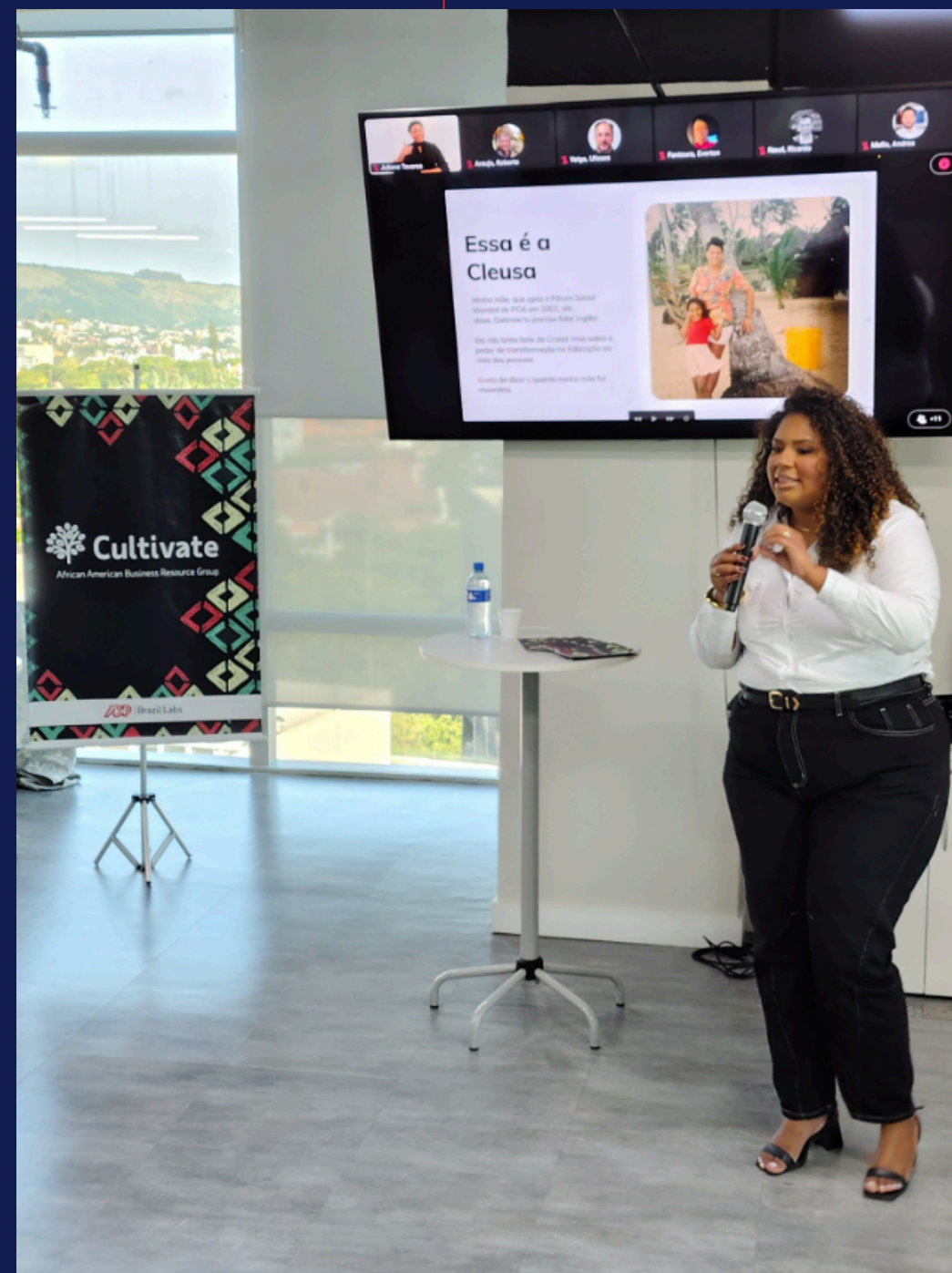
Imagem: registro da palestrante durante o evento. Porto Alegre, em novembro de 2025