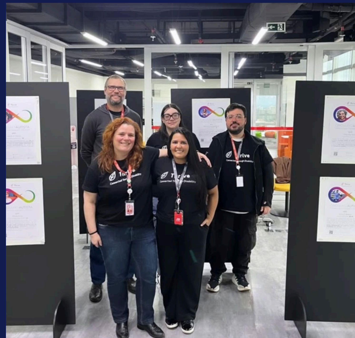
Imagem: registro dos membros do BRG Thrive na exposição. Porto Alegre, em julho de 2025