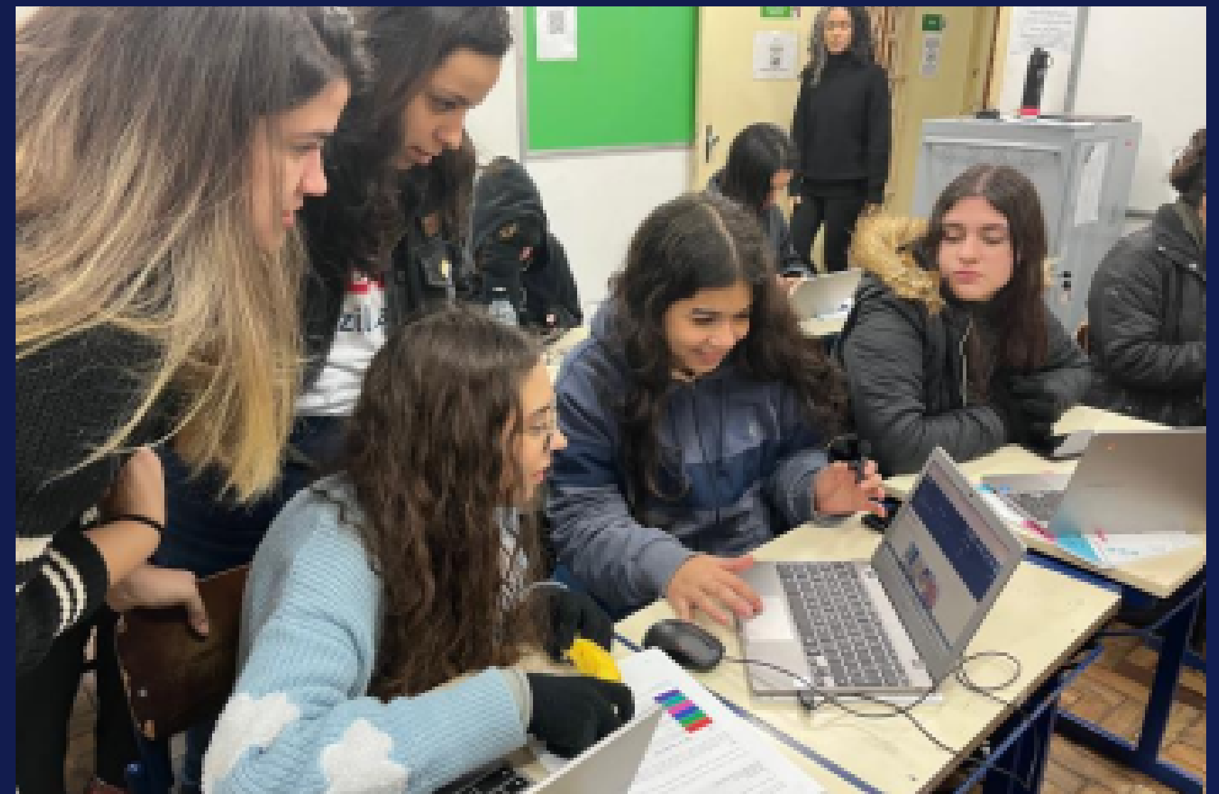
Imagem: registro das estudantes durante a mentoria na Escola Técnica Irmão Pedro. Porto Alegre, em agosto de 2025