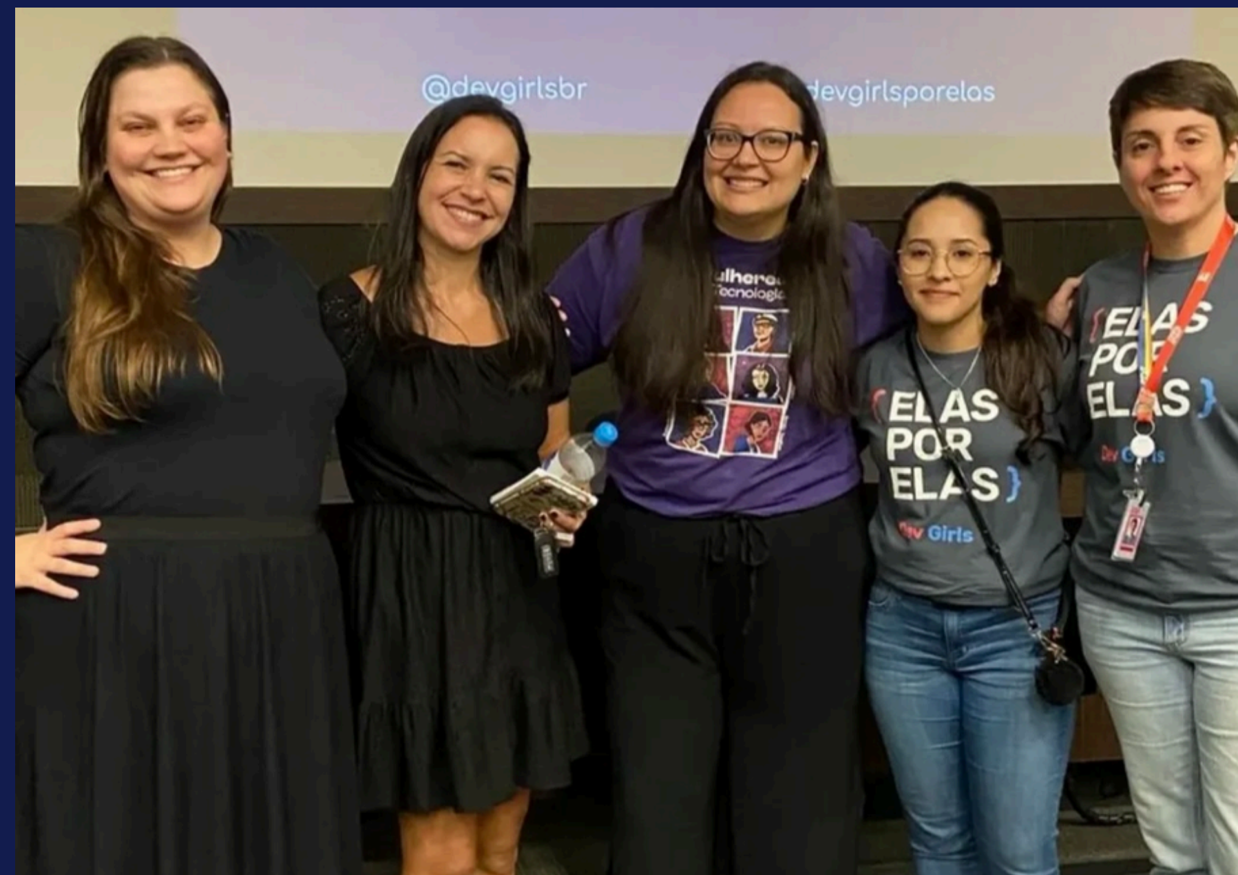
Imagem: registro do painel do Dev Girls com colaboradoras da Labs. Porto Alegre, em março de 2025