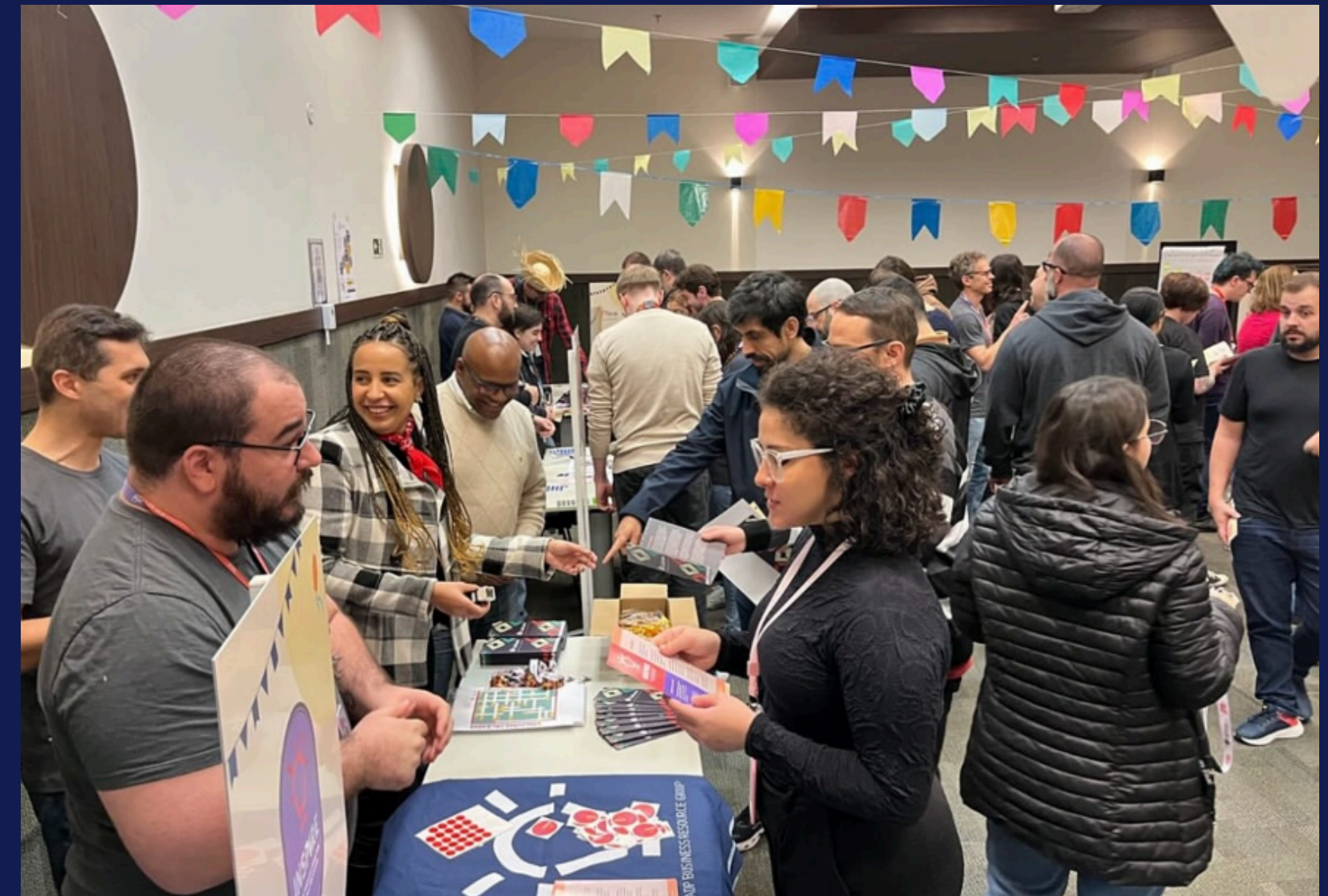
Imagem: BRGs e Comitês reunidos no auditório e colaboradores da Labs no evento. Porto Alegre, em julho de 2025.