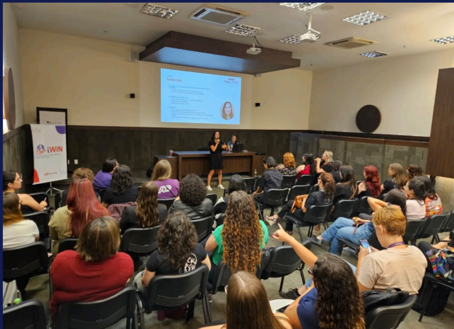
Imagem: registro das participantes do Dev Girls. Porto Alegre, em março de 2025