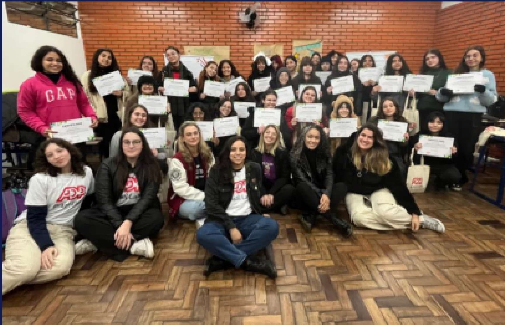
Imagem: registro da mentoria da equipe de colaboradoras da Labs no programa na Escola Técnica Irmão Pedro. Porto Alegre, em agosto de 2025