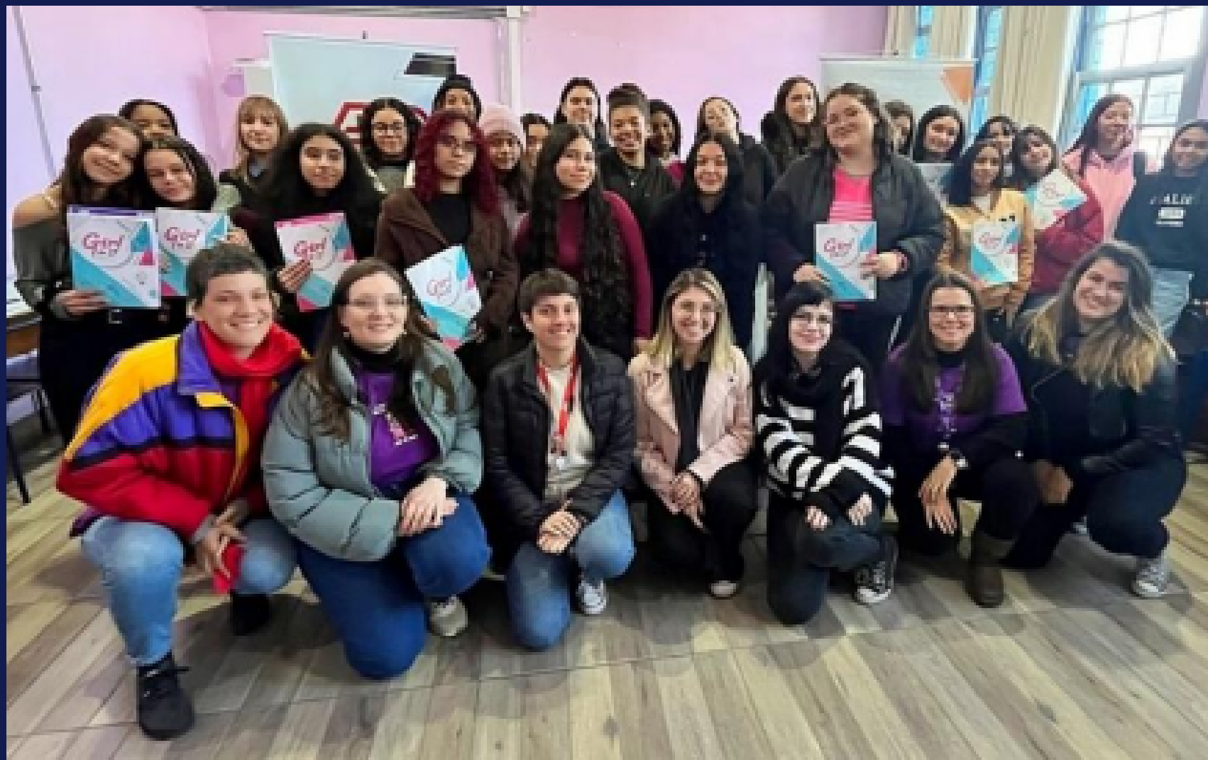
Imagem: registro da mentoria da equipe de colaboradoras da Labs no programa na Escola Estadual Rafaela Remião. Porto Alegre, em julho de 2025