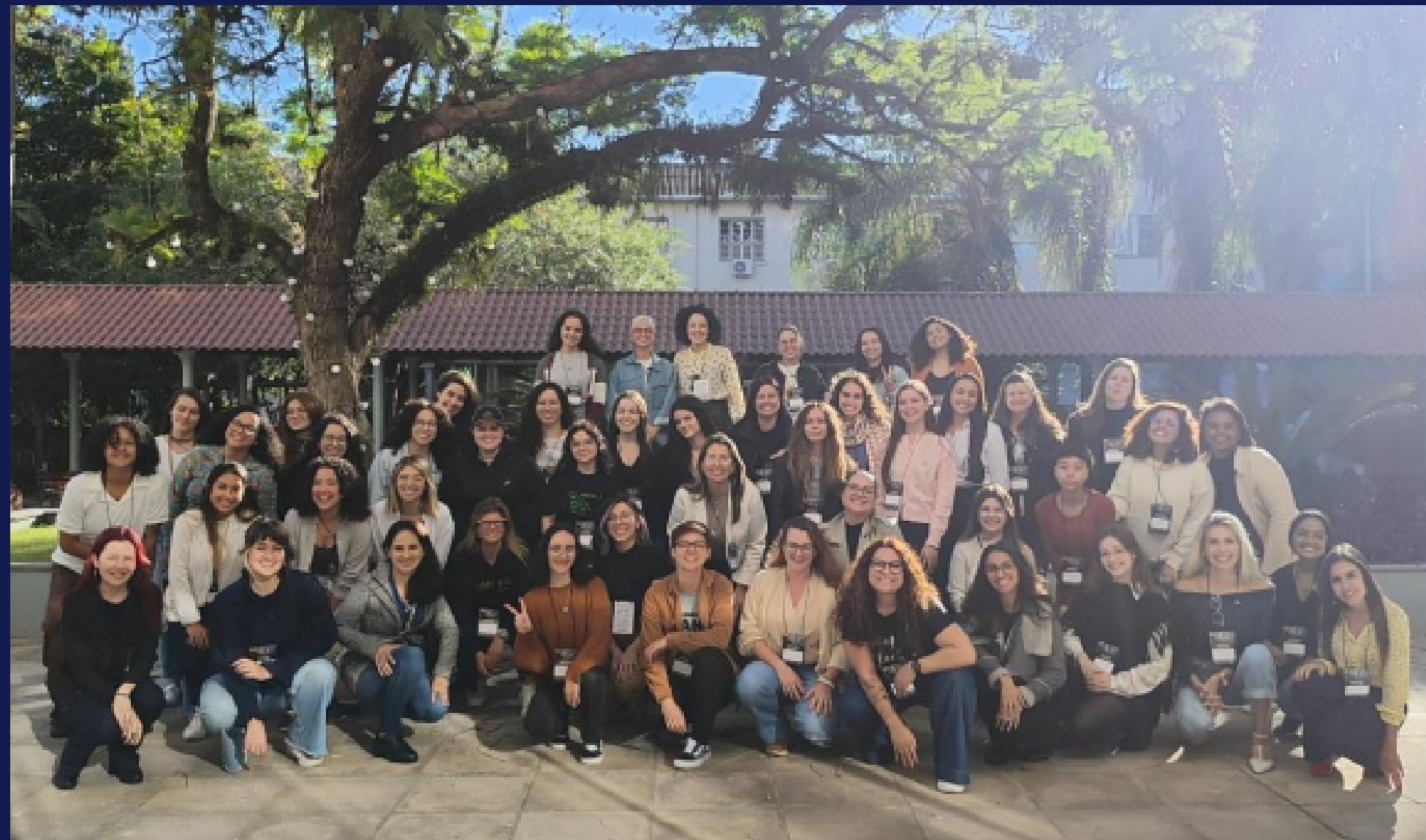
Imagem: registro das participantes do meetup. Entre elas, colaboradoras da ADP Brazil Labs. Canoas, em maio de 2025