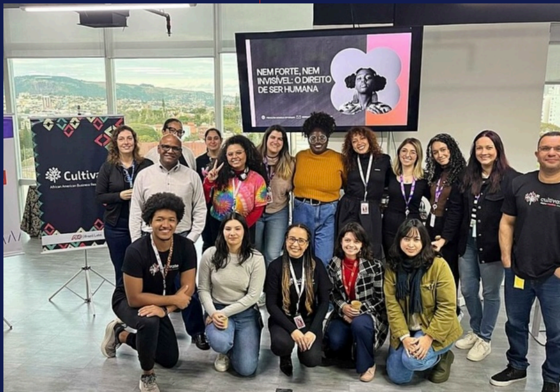
Imagem: registro dos participantes do evento com a palestrante. Porto Alegre, em agosto de 2025