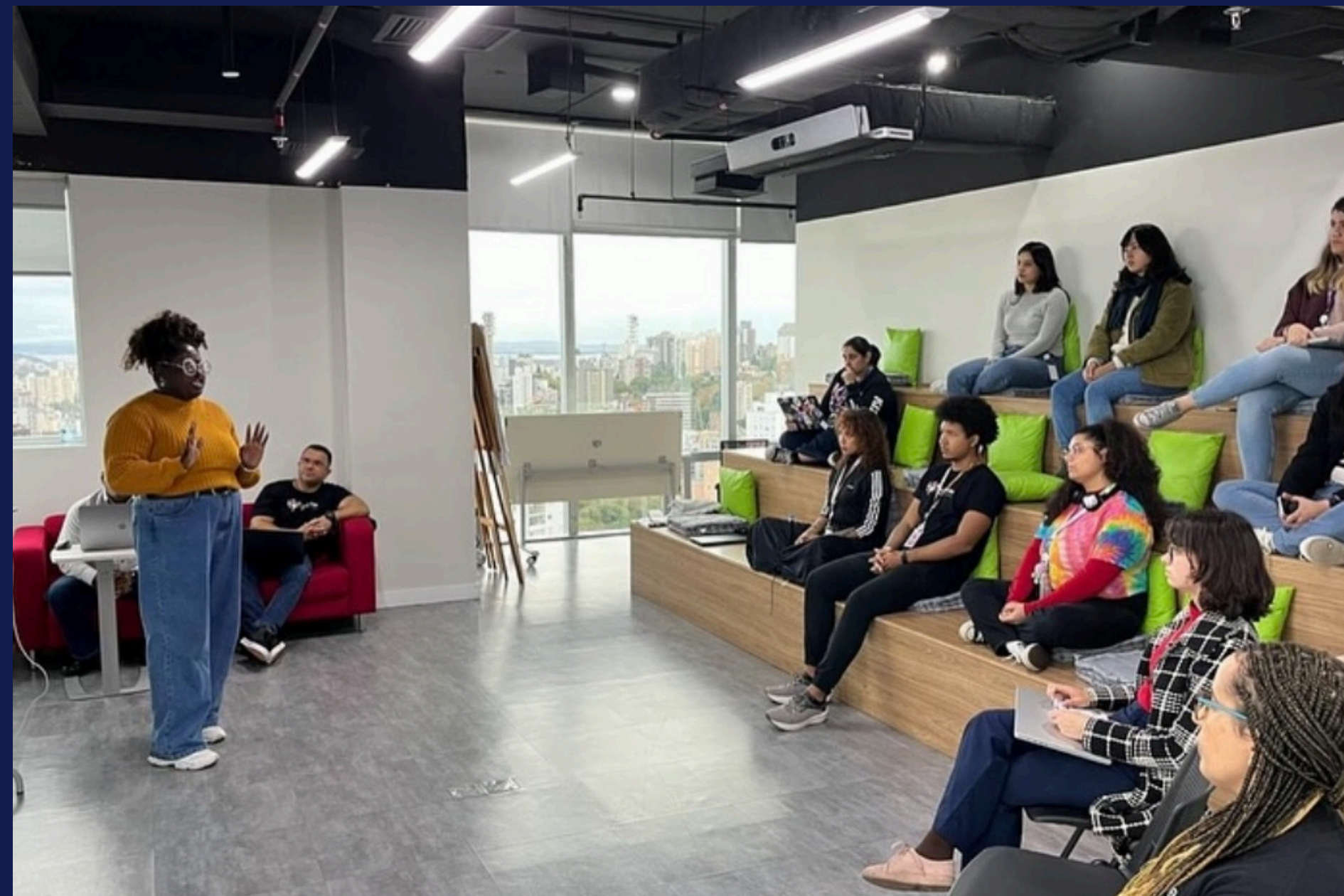
Imagem: registro dos participantes do evento com os palestrantes. Porto Alegre, em agosto de 2025