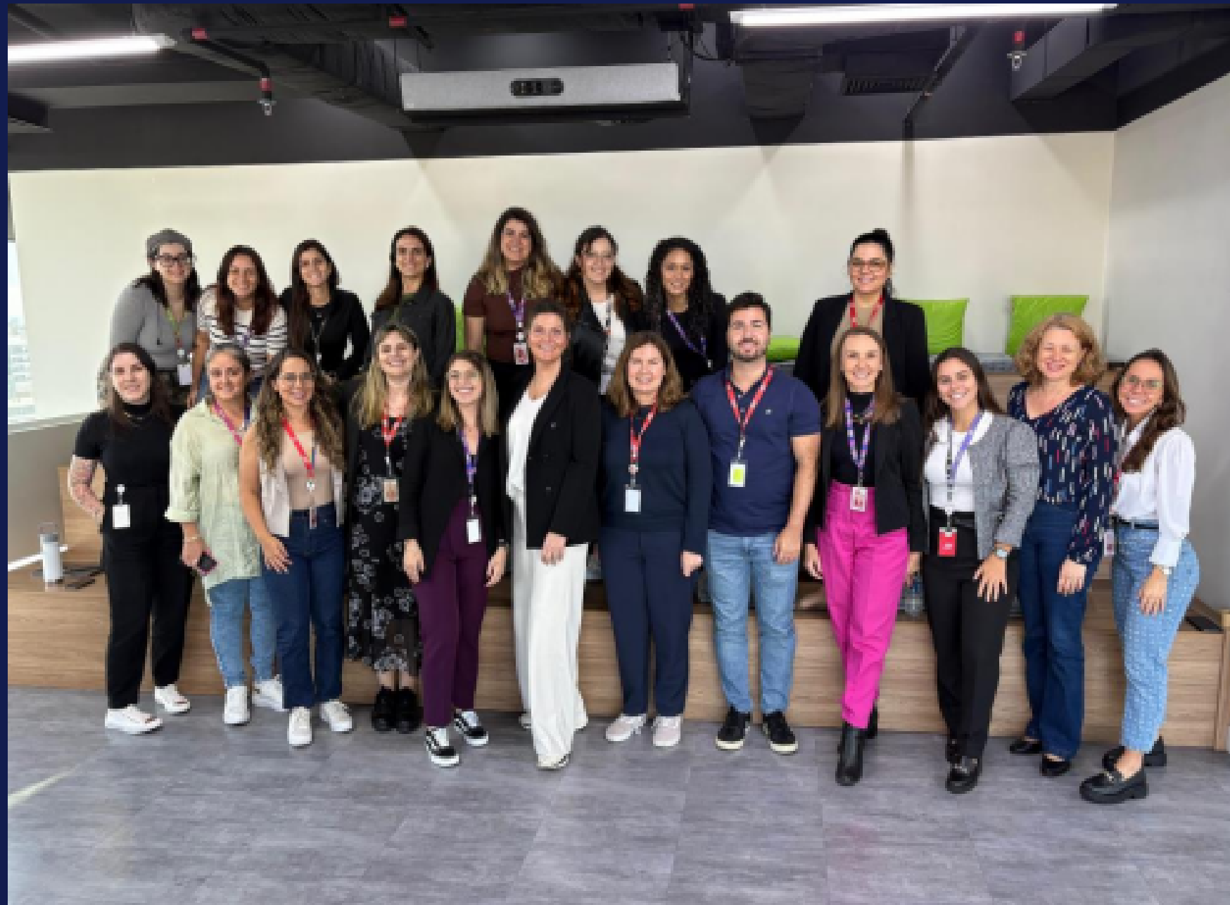
Imagem: registro das participantes do painel. Porto Alegre, em abril de 2025