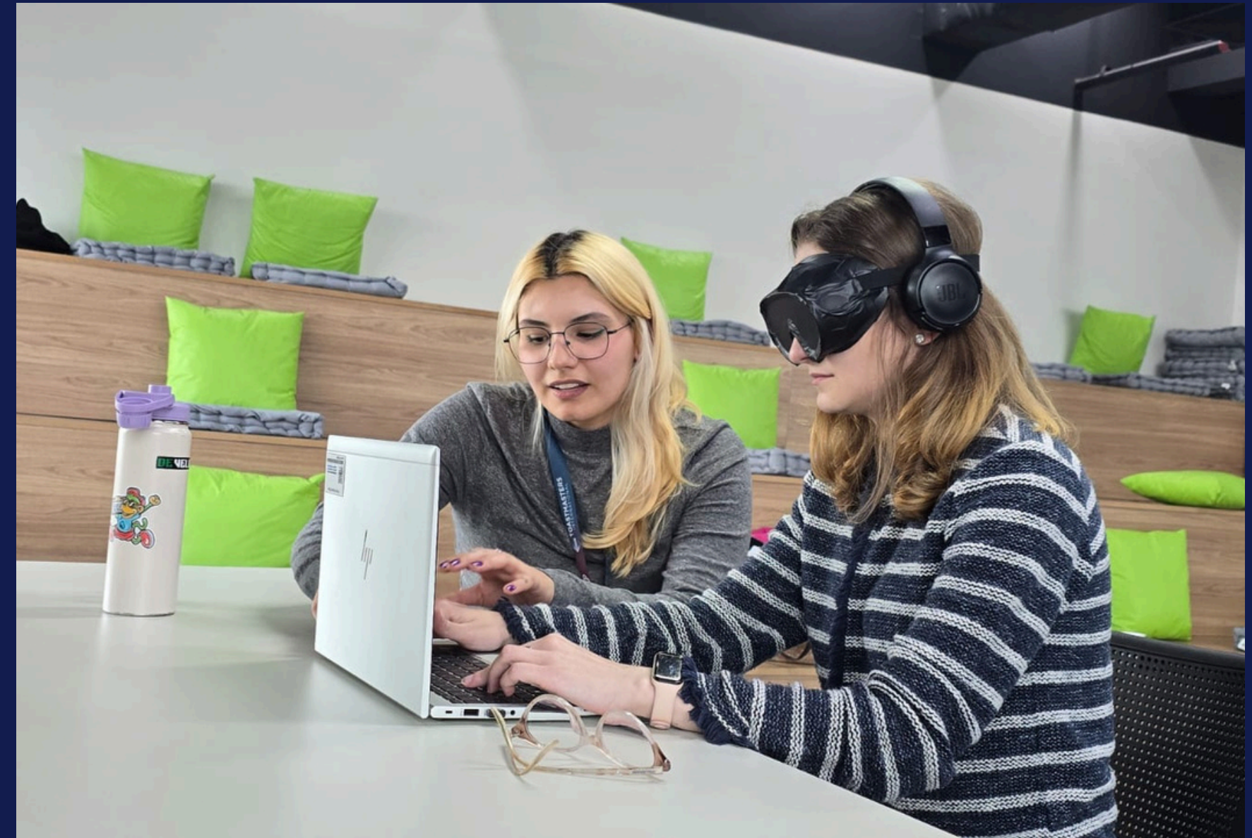
Imagem: registro da experiência no circuito sensorial. Porto Alegre, em outubro de 2025.