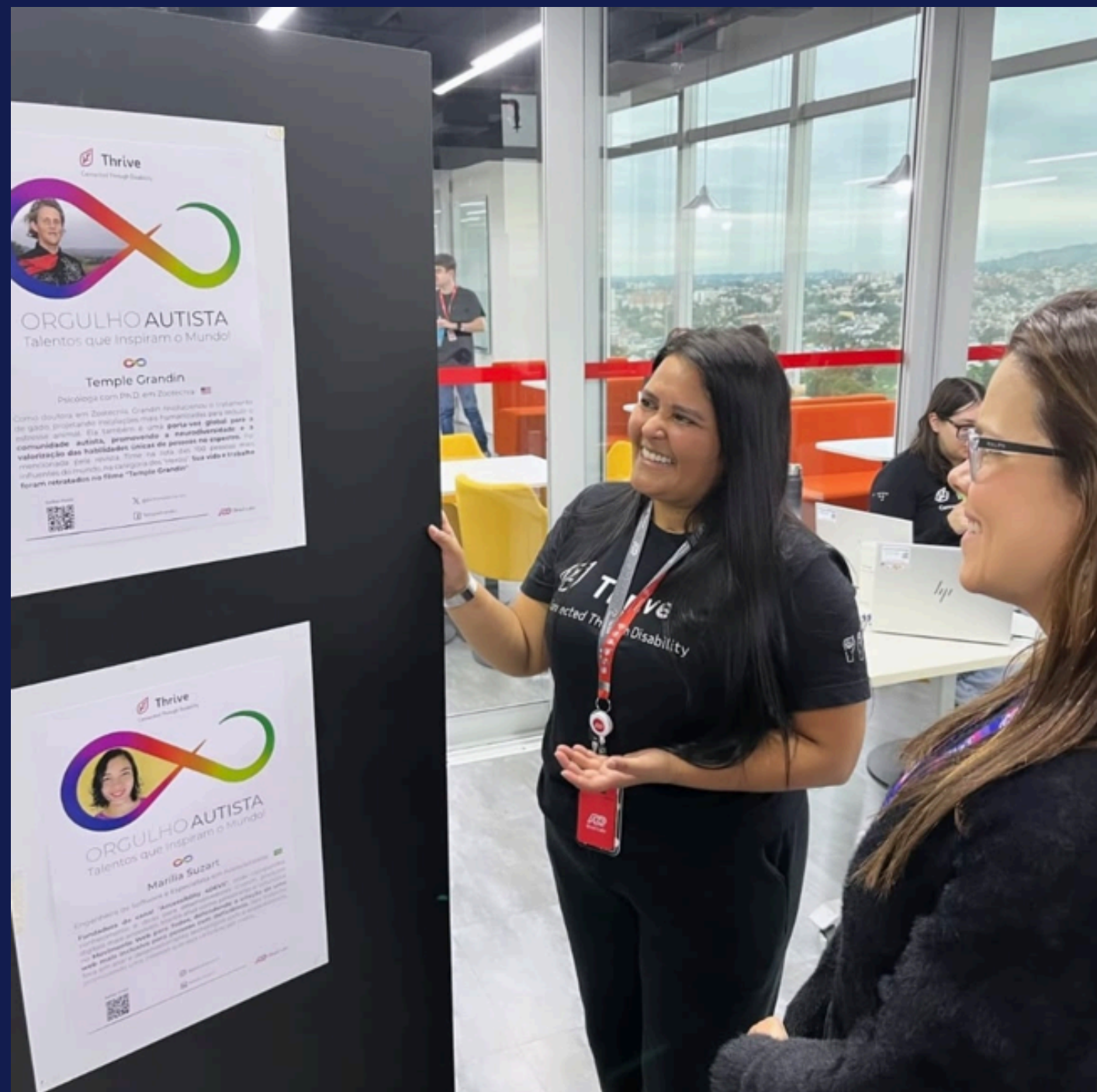
Imagem: registro da líder do BRG Thrive guiando a exposição. Porto Alegre, em julho de 2025