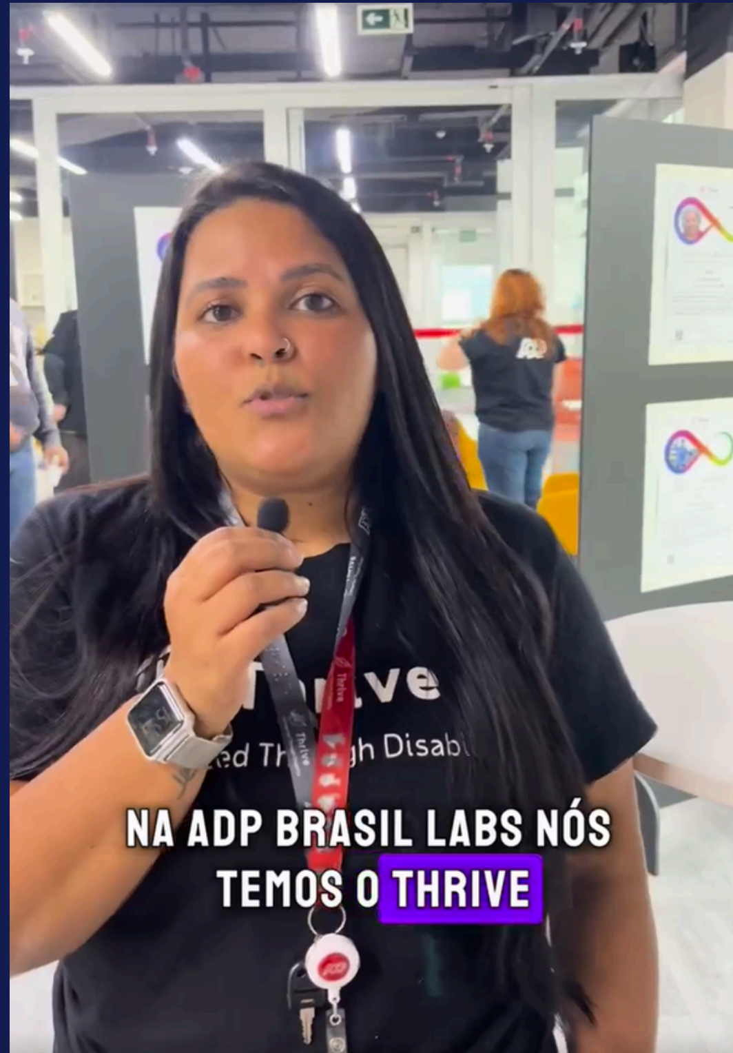
Imagem: Líder do BRG Thrive explicando sobre a exposição em vídeo publicado nas redes sociais