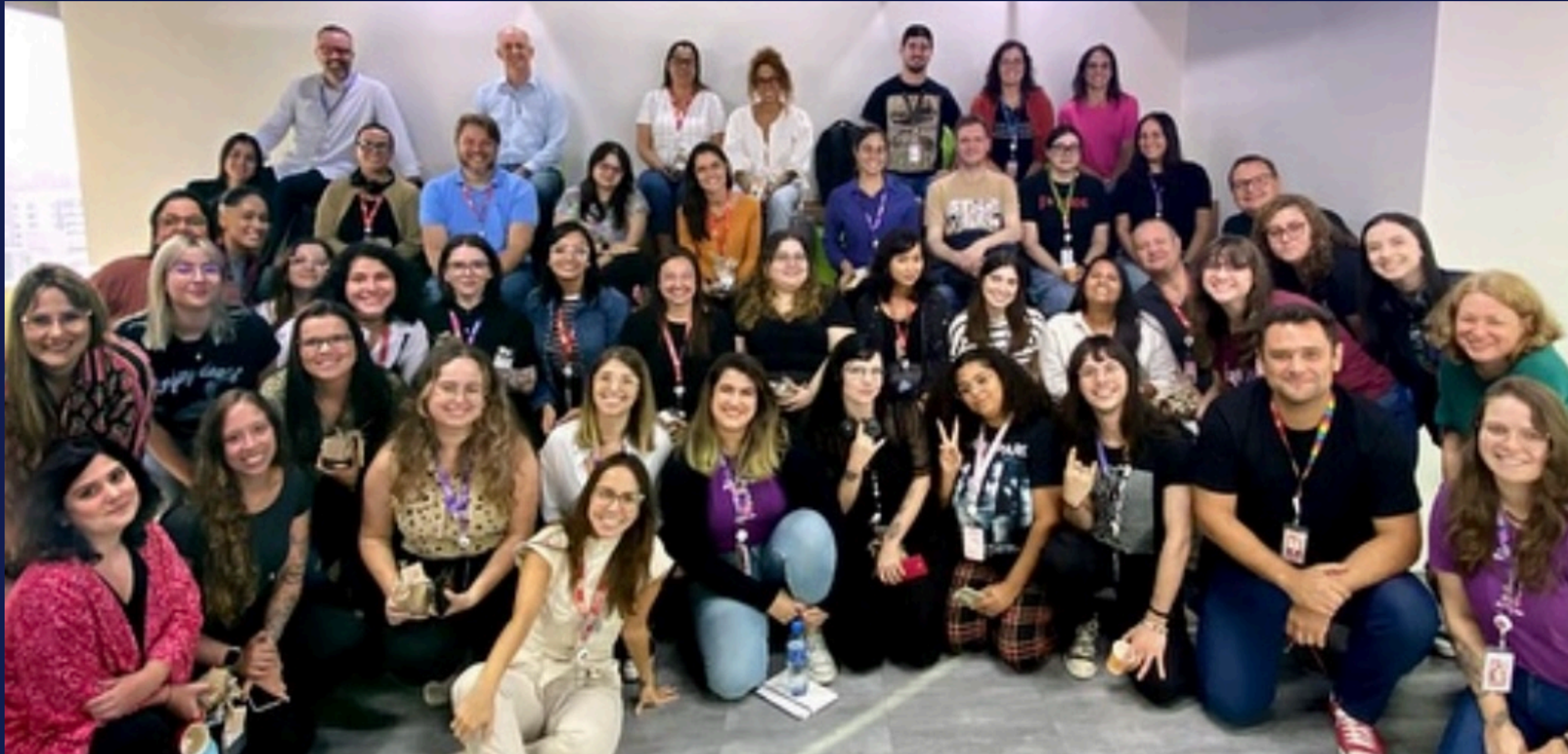
Imagem: registro das participantes do evento. Porto Alegre, em março de 2025