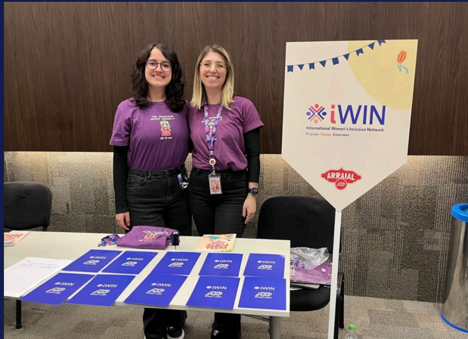
Imagem: membros do iWin apresentando o BRG no arraial. Porto Alegre, em julho de 2025.