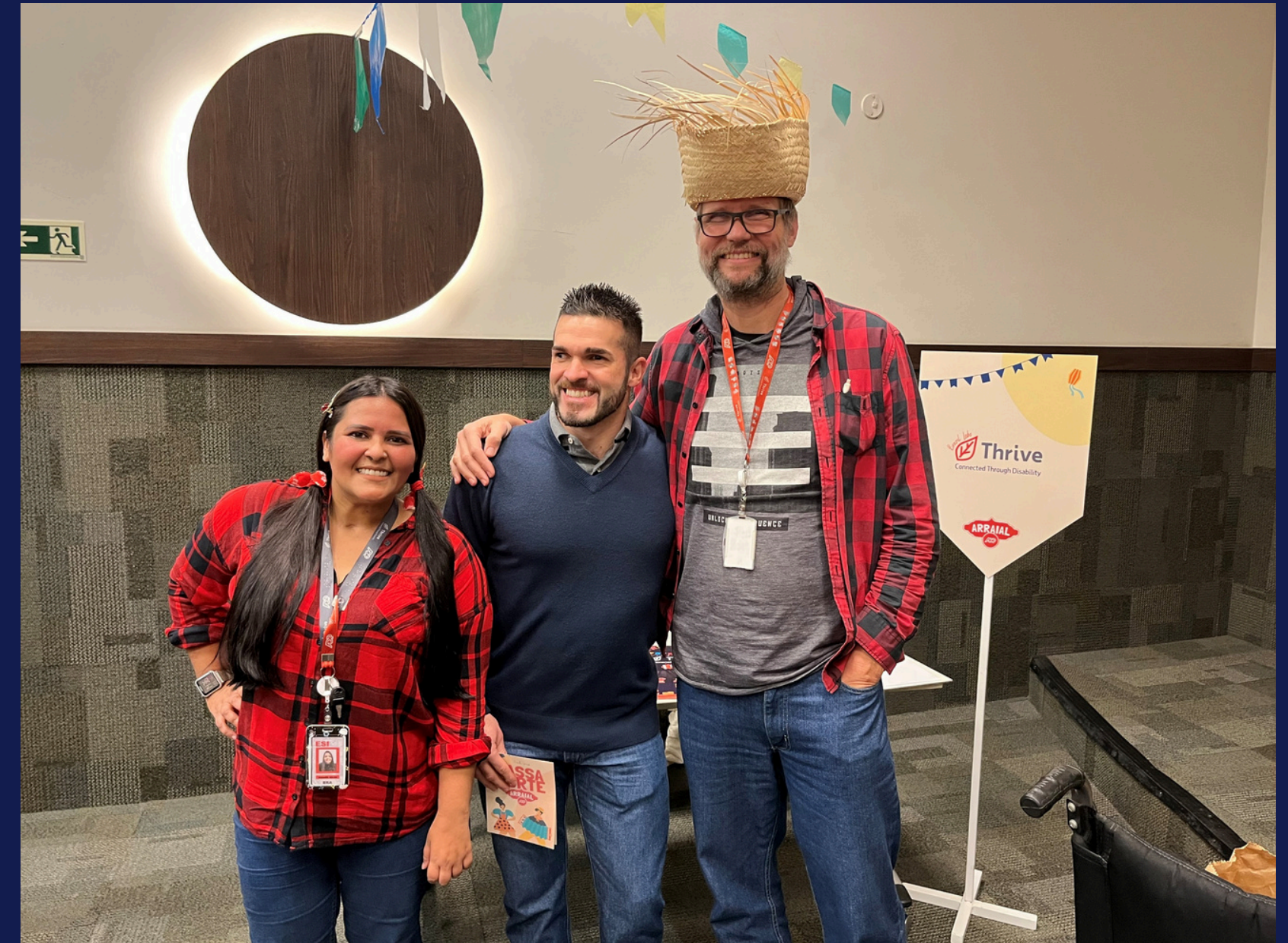
Imagem: membros do Thrive apresentando o BRG no arraial. Porto Alegre, em julho de 2025.