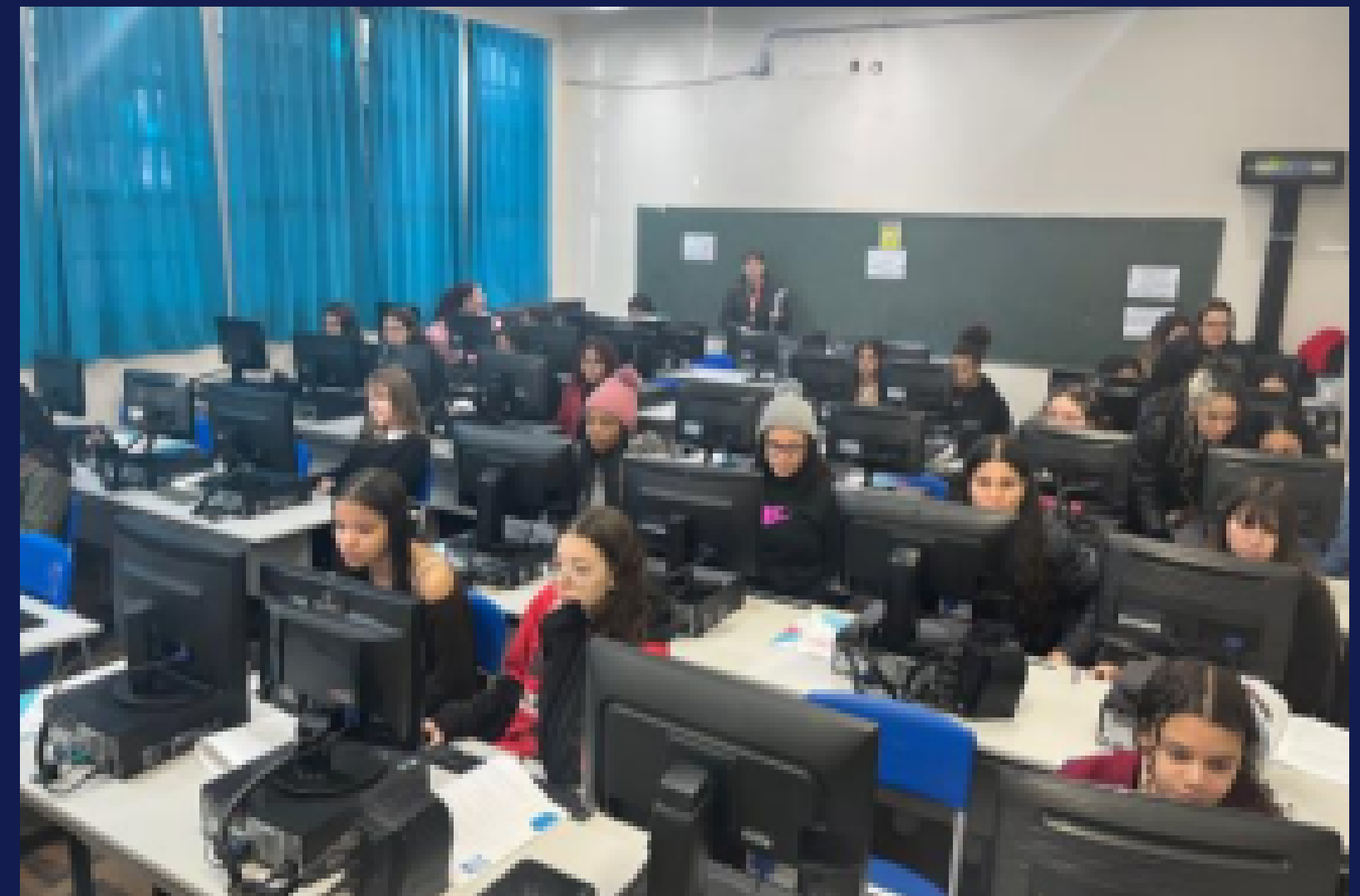
Imagem: registro das estudantes durante a mentoria na Escola Estadual Rafaela Remião. Porto Alegre, em julho de 2025